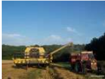
Récoltes des céréales