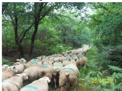
Transhumance d'une prairie à l'autre et par tous les temps !