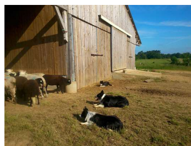
Les chiens devant la bergerie