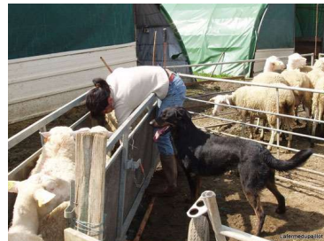
Les soins aux bêtes