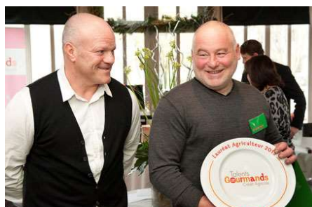
La récompense !

Abattoir réglementé et contrôlé. Traçabilité de la viande.