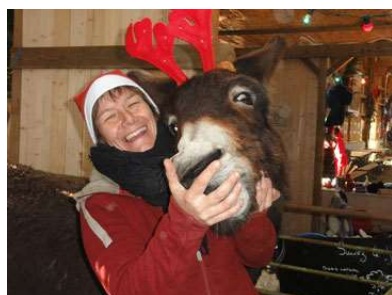
Accueil à la ferme pour fêter Noël