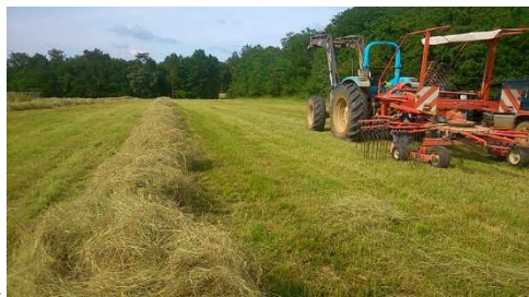
Fauchage des foins